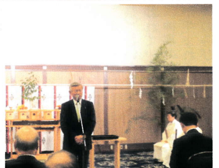
高木総代会会長の挨拶