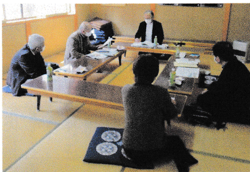
上野職芸学院教授の説明

三月二十七日(土)十時より責任役員四名と鶴坂神社禰宜とで、職芸学院上野教授から吊殿改築工事の説明を聞きましました。神殿と吊殿の屋根の繋ぎ方や吊殿内の照明等の話がありました。解体工事開始は六月末頃から始まり、十月末まで完了することに決まりました。